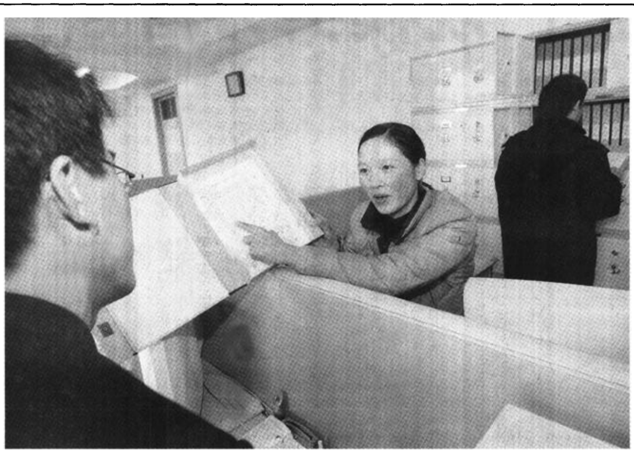
东营区史口镇为拓宽农民增收渠道,转移富余劳动力,今年6月成立了劳务输出服务中心,对全镇4000余名青年按专业特长登记造册,并通过与用人单位签订劳动协议、组织参加人才交流会等形式,在用人单位和农村劳动力之间架起了桥梁,深受当地农民好评。自成立以来,该中心已向当地企业输送劳动力316人,外地企业37人。

广饶讯 为了搞好村党支部、村委会规范化建设,广饶镇在全镇全面推行了村务大事村民代表大会票决、村干部集体办公、村干部定期征求群众意见、财务月公开、民主评议村党支部和村干部等五项制度。此举规范了村级运作,也促进了农村经济的发展和农村社会稳定。 村务大事村民代表大会票决制度。凡涉及村民切身利益的重大事项,先由村两委提出方案,经公示征求群众意见认可后,再提交村民代表大会进行票决。表决时,必须有80%以上的村民代表参加,并必须有到会人员的三分之二以上同意,否则无效,实现了“大家的事大家议大家定”。 村干部集体办公制度。每月的8号、18号、28号,村两委干部必须到村办公室集体办公,共同研究和处理村务。群众有事找村干部有了固定的时间和地点,所有决策和事务都是班子集体的意见,既增强了工作的透明度,融洽了村“两委”关系,又方便了群众。 定期征求群众意见制度。村干部要经常到群众家中听取群众的呼声和愿望,定期接受群众的提问和质询,解决工作中存在的问题,帮助群众解决实际困难,从而加强村干部群众之间的沟通和交流,融洽了党群干群关系。 财务月公开制度。各村建立规范的财务公开栏,每月8号对上月的结存、债权、债务、代收代缴费用、每月的财务收支、年底总帐等都依序公示。财务公开前,实行村财务监督小组集体审核,凡不符合规定的发票一律不予报销入账。 民主评议村党支部和村干部制度。由村民代表大会成员、共产党员、人大代表、政协委员对村党支部和村两委干部实行半年一小评,年终一总评。评议结果与村干部的工资待遇和调整使用挂钩,并作为评先树优和民主评议党员的重要依据。 (于洋 韩林 李友信)