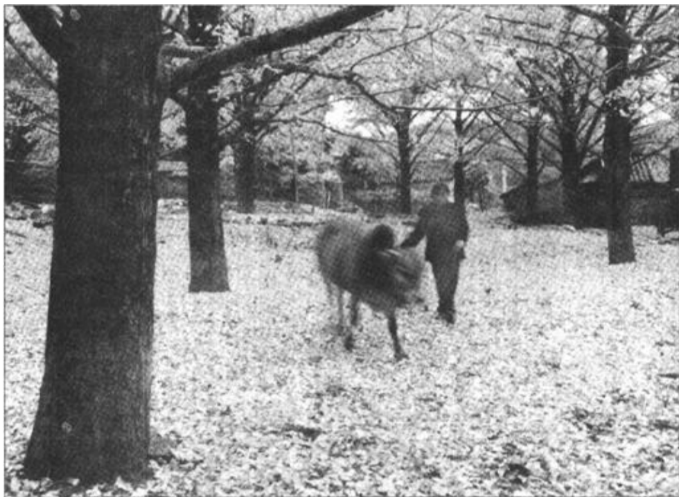
十二月三日，广西灵川县海洋乡马鞍山村农民赶着黄牛走过银杏林。广西灵川县海洋乡马鞍山村农民赶着黄牛走过银杏林。广西灵川县海洋乡马鞍山村农民赶着黄牛走过银杏林。

贷款；客户的存款利率低于现行定期存款利率，而贷款利率更大幅度低于现行个人住房贷款利率，如即将推出的最优贷款年利率为3.3%；住房储蓄合同一经签订，客户的存、贷款利率就固定下来，不受市场利率波动的影响；客户如有需要还可以灵活进行合同的变更、分拆、合并或转让。另外，客户只要将其住房储蓄和住房贷款用于住房消费就可以获得一定数额的奖励。