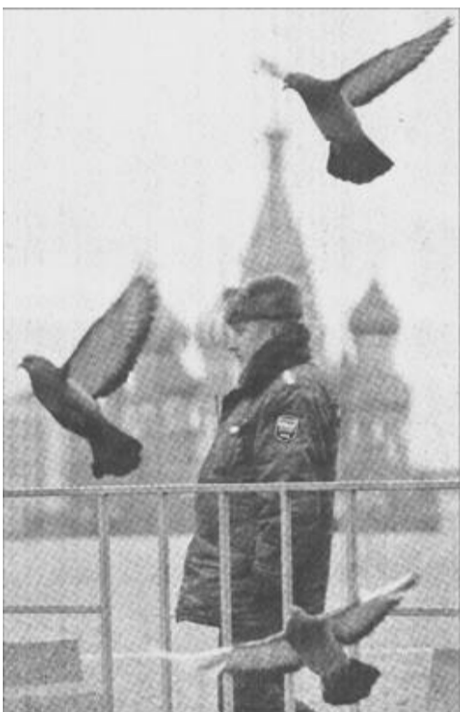
12月3日，一名警察在俄罗斯首都莫斯科的红场边守卫。今年7月以来，红场由于安全原因停止向游客开放。

的健康发展，成为商业银行新的风险表现形式。这位负责人说，各银行要深刻吸取教训，高度重视，切实加强票据业务内部管理，有效防范票据业务风险；要进一步明确银行承兑汇票业务各个岗位的职责，定期轮换重点岗位工作人员；采取切实有效措施防止关联企业利用银行承兑汇票骗取银行资金；加强票据业务内部审计工作；加大科技投入，提高票据防伪的科技含量。