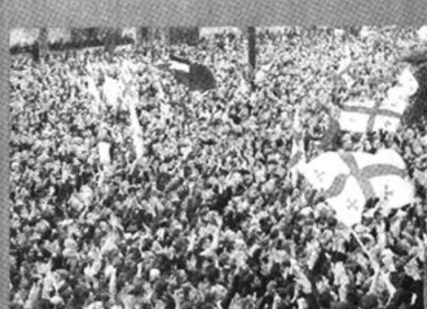
11月23日，格鲁吉亚反对派支持者在获悉谢瓦尔德纳泽辞去总统职务后欢庆胜利。