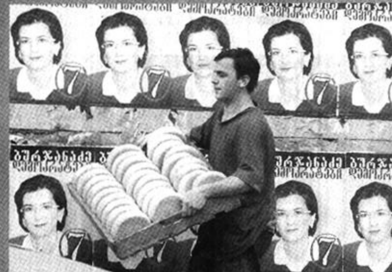
11月28日，一名格鲁吉亚男子在首都第比利斯街头从代总统布尔贾纳泽的宣传海报前走过。